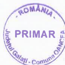
Primar, Victor CHIRILOAIE

În considerarea celor mai sus, în conformitate cu prevederile art.136 al.(1) din OUG nr.57 din 03 iulie 2019 privind Codul administrativ, propun Consiliului local adoptarea proiectului în forma inițiată.